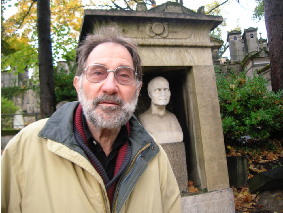
Figura 6.2: Who is mediating our discussion?